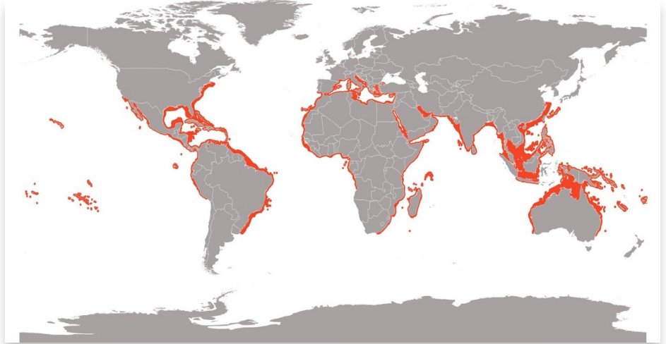
Distribución del tiburón de puntas negras ( Carcharhinus limbatus ). Mapa elaborado por Daniela García Jiménez.

Distribución: Se puede encontrar en casi todos los océanos del mundo: Índico, Atlántico, Pacífico; además del Mar Mediterráneo y el Mar Negro, siendo una especie circuntropical