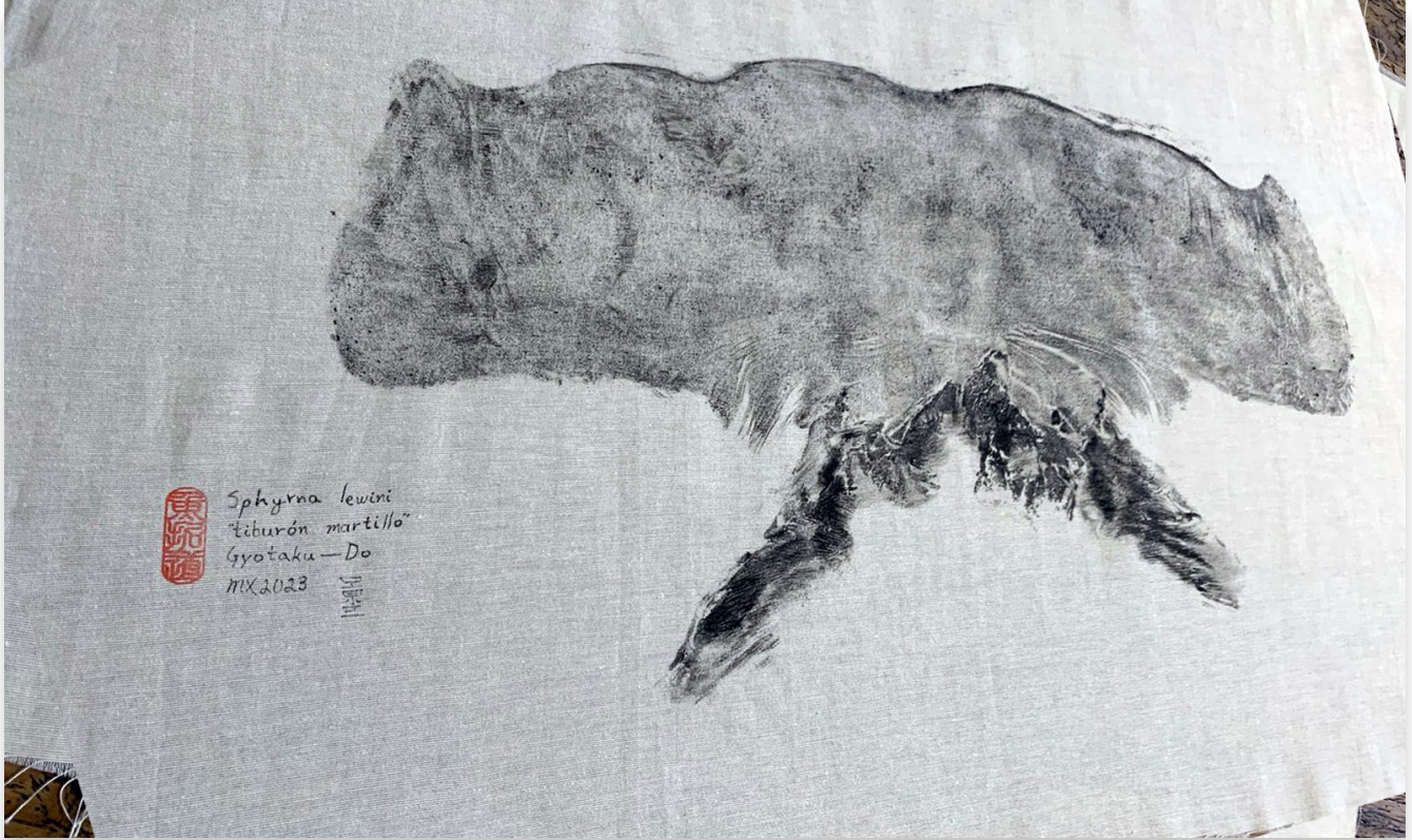
Gyotaku del tiburón martillo, elaborado por Keisdo Shimabukuro 魚拓道