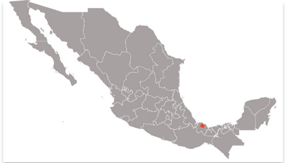
Distribución de la pepesca ( Astyanax caballeroi ). Mapa elaborado por Daniela García Jiménez.