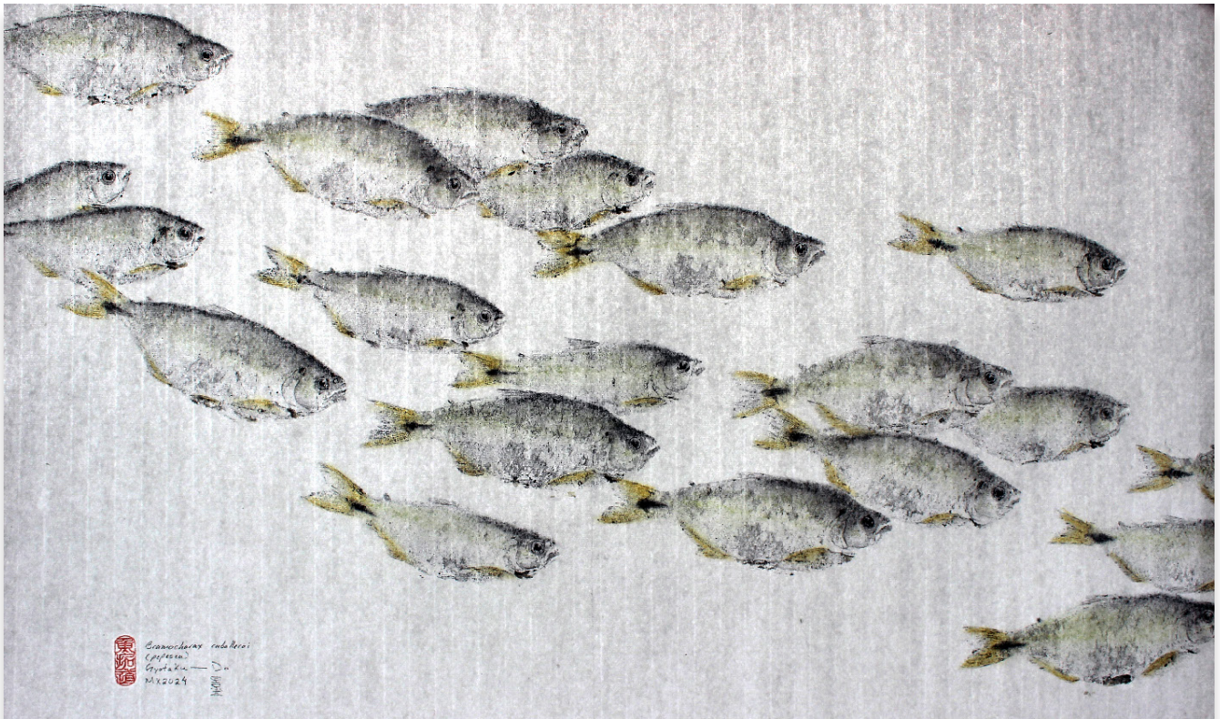
Gyotaku de la pepesca, elaborado por Keisido Shimabukuro 魚拓道