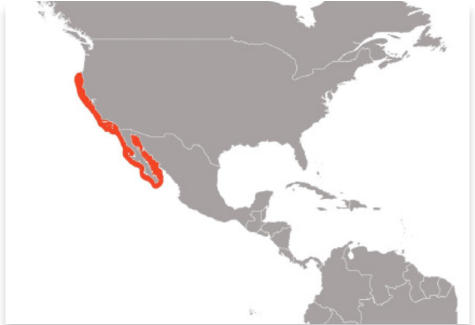
Distribución de la vieja californiana ( Semicossyphus pulcher ). Mapa elaborado por Daniela García Jiménez.