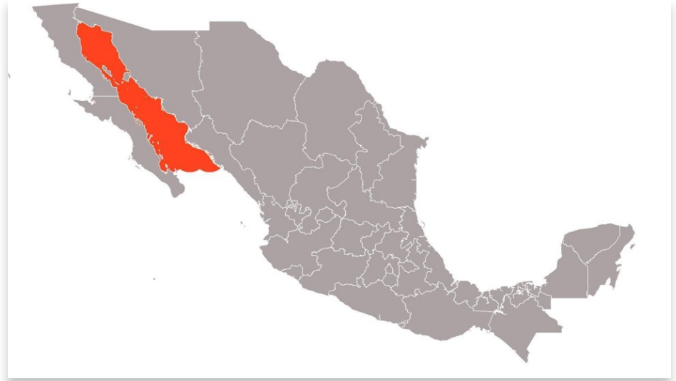
Distribución de la totoaba ( Totoaba macdonaldi ). Mapa elaborado por Daniela García Jiménez.

Distribución: Es una especie endémica, distribuida en el Alto Golfo de California (México).