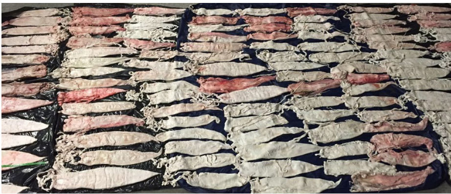
Vejiga natatoria de totoabas (buchs).

La totoaba, también conocida como corvina blanca, curvina, roncador o tambor por su habilidad de producir sonidos con su vejiga natatoria, es un pez longevo que puede vivir hasta 50 años.